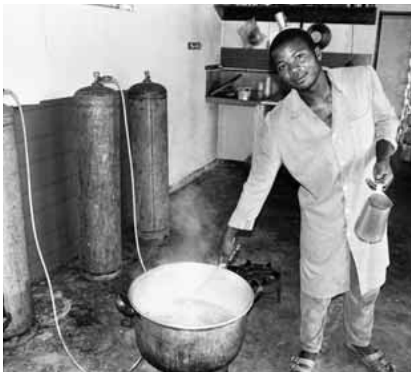
Fabrication de confitures.

La clé d'une initiative de commerce équitable n'est pas seulement d'offrir des débouchés et des