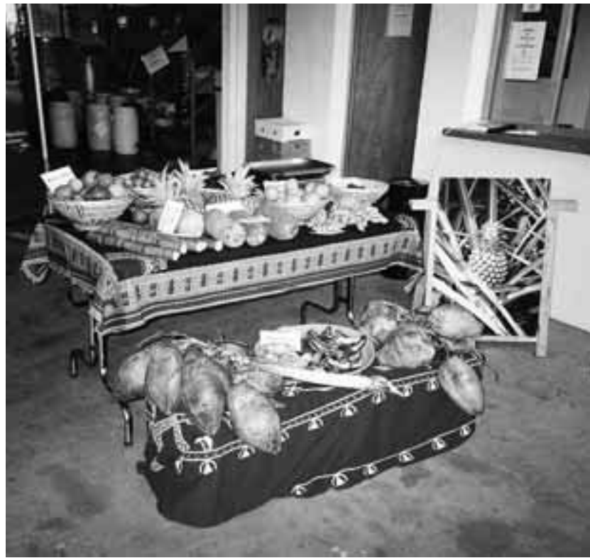
Une belle variété de produits.

Les initiatives se sont multipliées, malheureusement sans grand succès jusqu'ici. Mettre sur pied une filière stable et efficiente, avec des variétés et une qualité de produits correspondant à la clientèle en Suisse, est une entreprise ardue et de longue haleine, qui se heurte à de nombreux obstacles. Ainsi, le Congo-Brazzaville – qui avait bien démarré – a plongé dans la guerre civile, le coordinateur en Côte d'Ivoire est décédé tragiquement, le doublement du prix du fret par Air France suite à la banqueroute de Sabena a sonné le glas de l'expérience béninoise et mis en veilleuse le réseau togolais. Le projet en Tanzanie a buté sur des problèmes d'emballage, celui de Madagascar sur les coûts exorbitants de transport aérien. Pour de nombreux pays, l'absence de vols