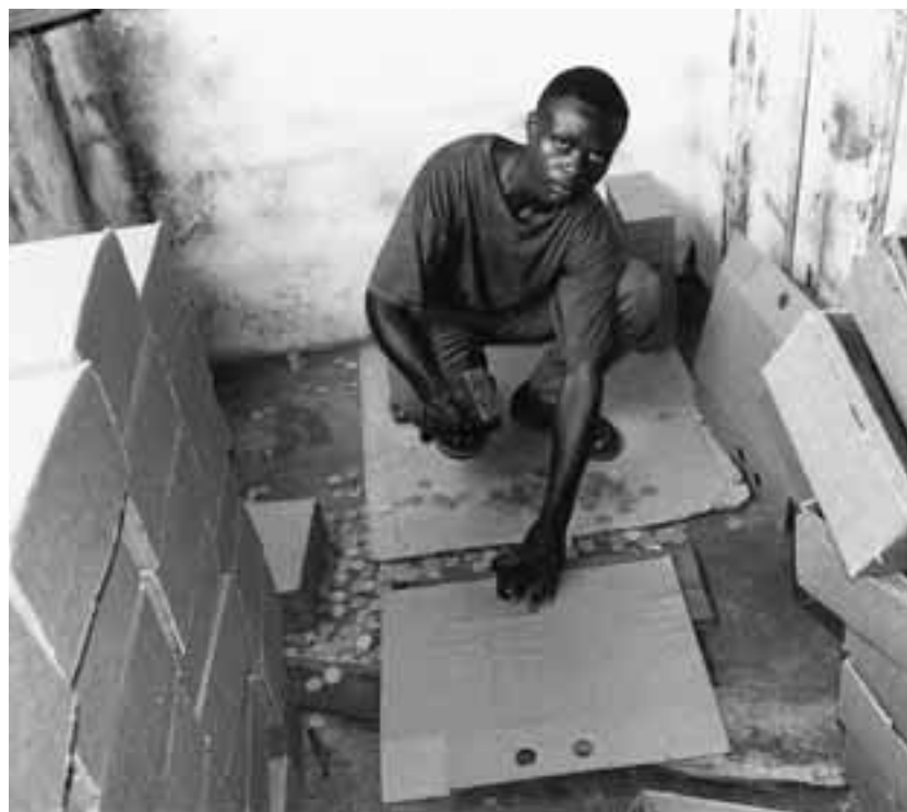
Production de cartons : l'art du recyclage.